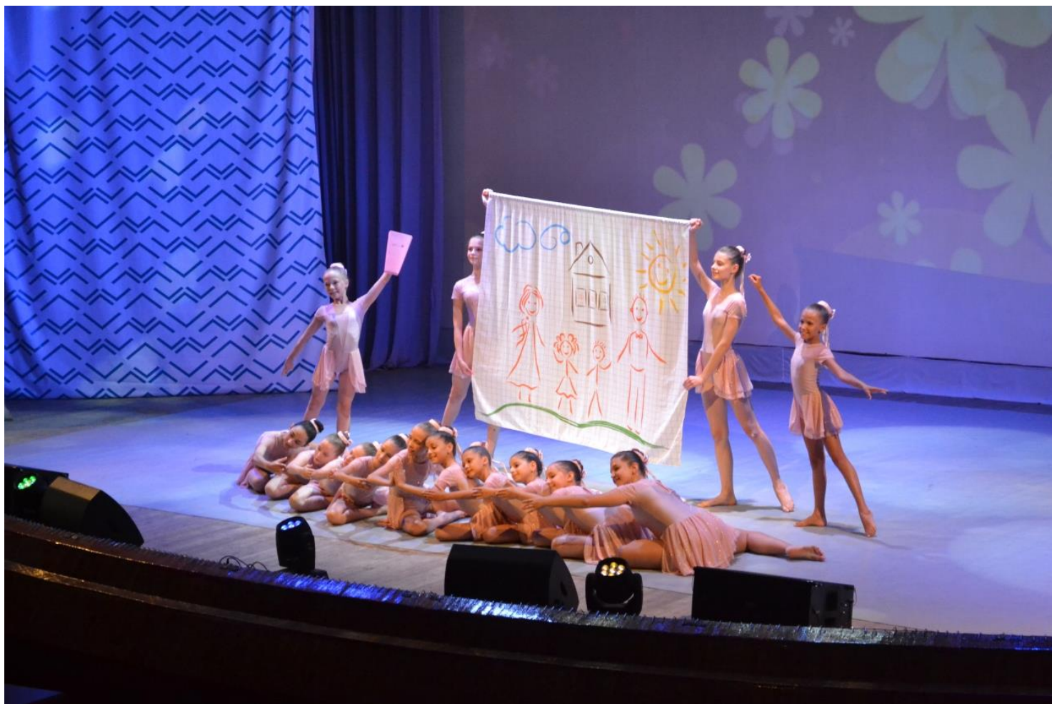
Участие в концерте «Вечер знакомств» II АРТ фестиваля "Салют, Орлёнок!" «Мир глазами детей», средняя группа №2

На осенних каникулах 2019 года наш ансамбль впервые принял участие в юбилейном 80-ом Российском конкурсе юных талантов «Орлята России». Заявлены были две номинации. По итогам конкурса мы дважды стали лауреатами I степени. Во время конкурсных дней мы очень прониклись атмосферой «Орлёнка» и загадали желание вновь сюда вернуться. И вот снова каникулы, но теперь летние... Несмотря на Covid-19, несломленный духом Орлёнок принимает детей из Краснодарского края. И такой счастливый билет достался и нам. С 1 по 14 июля 2020 года дети из трёх групп нашего ансамбля приняли участие в юбилейной 7 смене II Арт-фестиваля «Салют, Орлёнок!». Позади три месяца самоизоляции, общения с детьми через монитор компьютера. И вот, наконец, мы смогли не только увидеться, но и не раз выйти на сцену Дворца культуры и спорта Всероссийского детского центра и наслаждаться этими минутами, танцуя наши любимые номера.